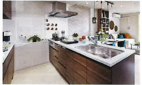
フルオープンで開放的なフレタスキッチン