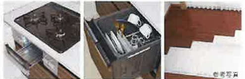
ホーロートップ 3口コンロ+無水グリル 食器洗い乾燥機 TES温水式床暖房