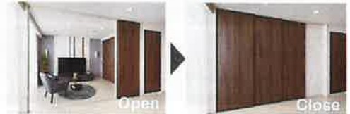
開閉自在、スライド引戸

※A, Ag, D, Di, J, Jg, Js, M, Mg, Ms, O, Og, Osタイプを除く