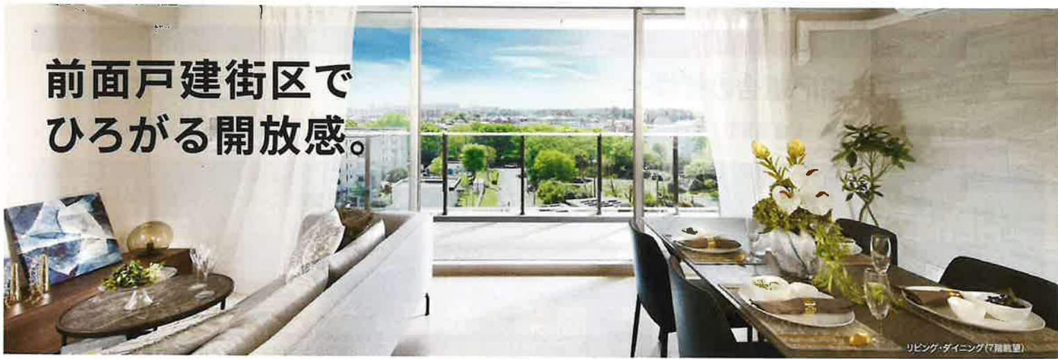
リビング・ダイニング(7階眺望)